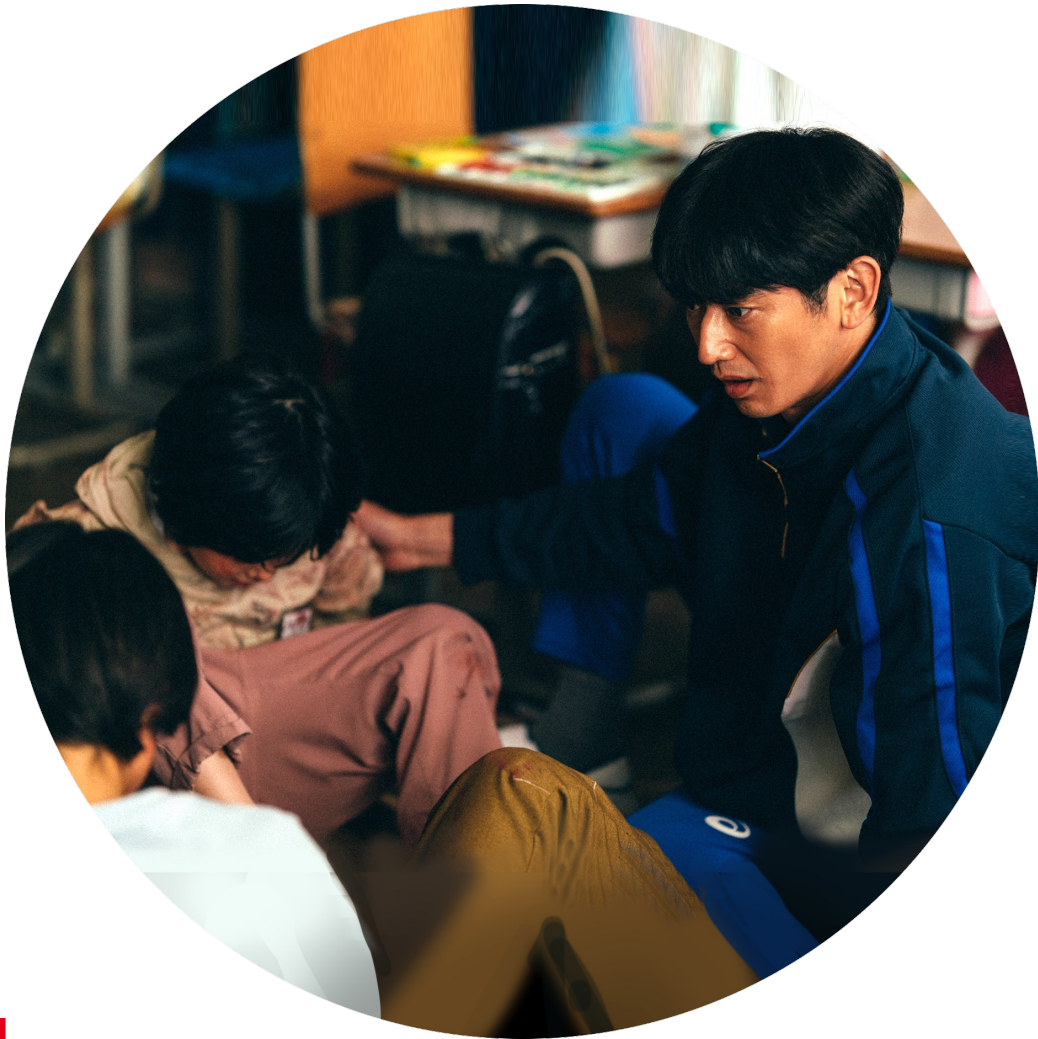
Kadr z filmu „Monster”, reż. Kore-eda Hirokazu