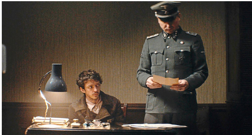
Zdj. 3 Główni bohaterowie filmu „Poufne lekcje perskiego”.

Proponujemy uczniom przeanalizowanie historii dwóch głównych bohaterów filmu, zwracając uwagę na to, że ich relacja to niezwykle rodzaj pojedynku, a tytułowy język perski to oręż, rodzaj używanej broni.